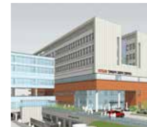
경북권 감염병 전문병원